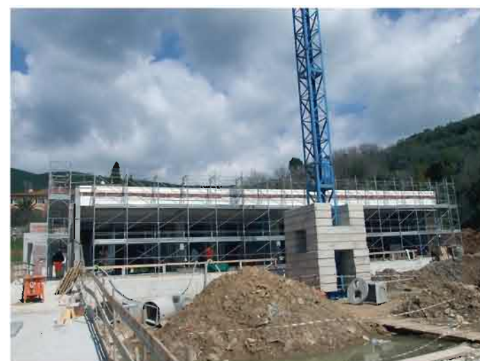
In foto: il cantiere del nuovo Nido di Infanzia

Saranno possibili le iscrizioni per i residenti e per i non residenti.