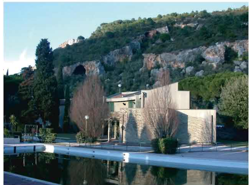
In foto: una veduta d'insieme della piscina a Uliveto e del monte.

Chi desidera leggere la sentenza completa può andare su internet riscrivendo nella barra degli indirizzi il seguente link: http://www.giustizia-amministrativa.it/DocumentiGA/Consiglio%20di%20Stato/Sezione%205/2012/201202768/Provvedimenti/201301823_11.XML