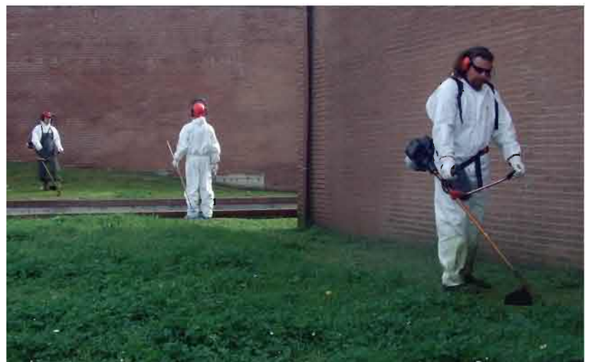
In foto: la giunta direttamente all'opera nel taglio dell'erba a marzo 2011 per protestare per la mancanza di risorse.

Il Comune vista la stagione particolarmente piovosa ha aspettato a tagliare l'erba affinché l'operazione non fosse vanificata entro poco dalla crescita rigogliosa del verde.